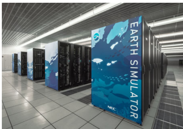
図1 ES4 外観

計算ノードは、CPUのみを搭載した「CPUノード」、NEC社製 SX-Aurora TSUBASA を搭載した「VE搭載ノード」、NVIDIA社製 GPU A100 を搭載した「GPU搭載ノード」から構成される。それぞれのノードは同一のインターコネクトネットワーク(IB HDR 200 Gbps)上で接続されており、複数アーキテクチャにまたがった計算や全ノードを利用した計算の実行も可能となっている(図2、