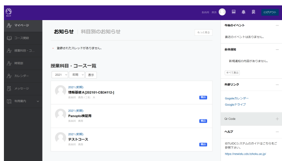
図1 新LMSのマイページ画面

新しい授業収録配信・学習支援システムの仕様は上記したような従来システムの運用の中で確認された種々の課題を踏まえて決定された。本節では、新システムの概要および代表的な特徴について述べる。