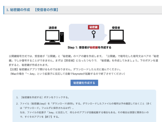
図 2 公開鍵暗号方式体験ツール